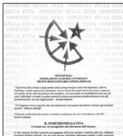
IL VOLANTINO DELLA FAI

timore degli inquirenti che ammettono: «La Fai entra a pieno titolo nella lotta armata in Italia». L'allerta resta alta. Sempre nella lettera la FAI ha annunciato una campagna contro «Finmeccanica assassina» e l'intenzione di compiere altri 8 attentati «quanti sono i membri prigionieri della Ccf/Fai detenuti in Grecia». Intanto, in risposta agli anarchici, i lavoratori di Ansaldo si fermeranno un'ora lunedì prossimo per «dire no a qualsiasi forma di violenza».